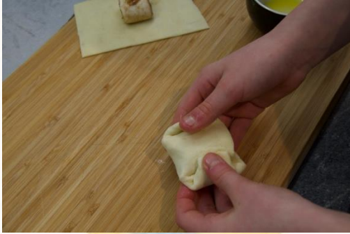
5. Zu einem Päckchen falten