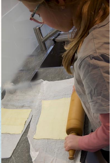
1. Teig ausrollen

EMMA zeigt uns mit Ernie, wie ihr die Kekse backen könnt - ganz schnell und