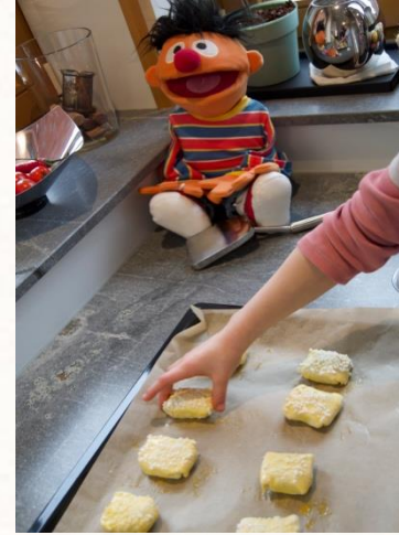
7. Auf Backblech ausrichten