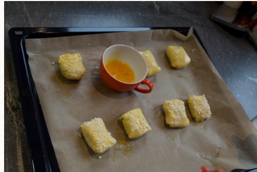
6. Auf Backblech legen und mit verquirltem Ei be- streichen und Hagelzucker drauf streuen