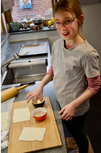
3. Marshmallows in Zimtzucker + geschmolzener Butter wenden