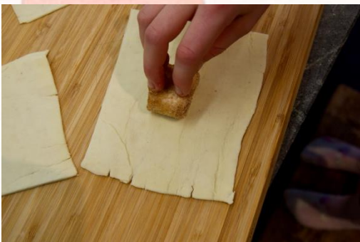
4. Mittig auf Teig legen