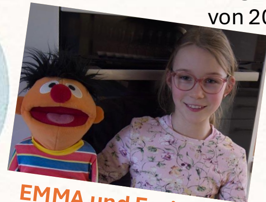
EMMA und Ernie