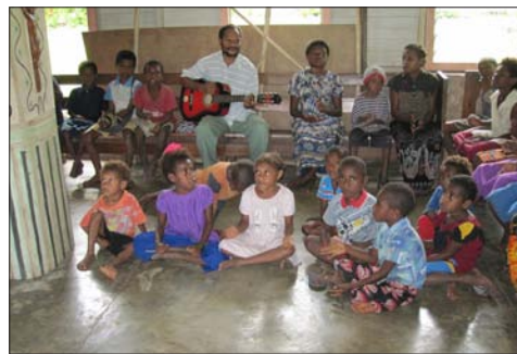
Kinder des Kindergottesdienstes, die mit ihrem Gesang die Gemeinde herbeisingen (auch Suquam)