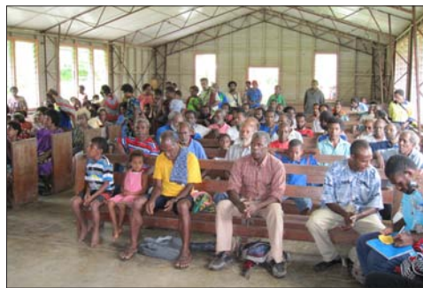
Die Gottesdienstgemeinde in Suquam an der Küste von Papua Neuguinea